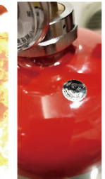
消防署測試 認可品貼紙