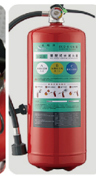
無縫拉伸鋼瓶 品質有保障