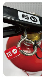
拉拔設計的 安全插銷標示